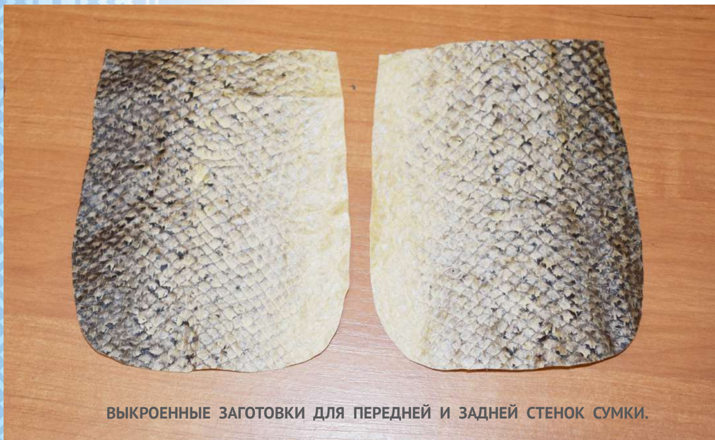
ВЫКРОЕННЫЕ ЗАГОТОВКИ ДЛЯ ПЕРЕДНЕЙ И ЗАДНЕЙ СТЕНОК СУМКИ.