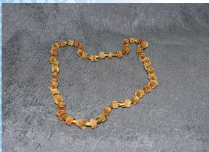
Бусы. Позвонки рыб, бусины. 2015 г.