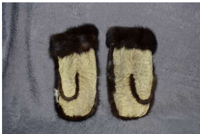
Варежки. Кожа налима, щуки, мех норки. 2015 г.