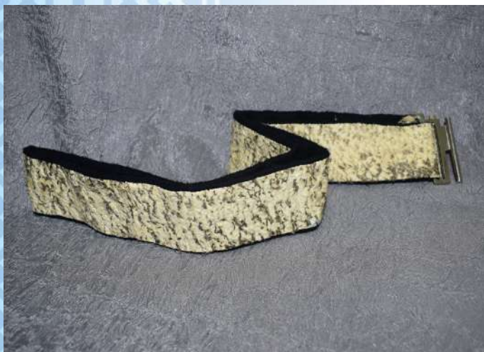
Пояс. Кожа щуки, ткань. 2015 г.