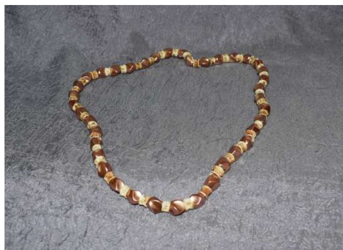
Бусы. Позвонки рыб, бусины. 2015 г.