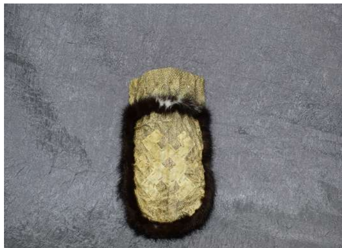
Сумочка. Кожа налима, мех норки. 2015 г.